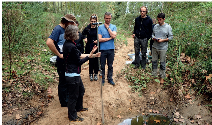
Učesnici uče od IRES stručnjaka tokom škole za obuku u Gironi – Španija