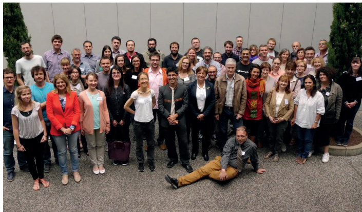
Članovi Upravnog odbora SMIRES sastali su se u Institutu IRSTEA – Francuska

SMIRES je COST akcija koju finansira Evropska unija sa ciljem umrežavanja, izgradnje kapaciteta i sintetiziranje znanja iz oblasti istraživanja i upravljanja IRES staništima. Okupili smo pripadnike akademske zajednice kao i menadžere u oblasti upravljanja vodama,iskusne istraživače kao i one na početku karijere, i naučnike iz različitih država kako bi ostvarili zajednički cilj: unaprijediti istraživanje i upravljanje IRES staništima. Naši članovi dijele različita iskustva i stručnost koja će omogućiti razvoj novih i ponekad neočekivanih multidisciplinarnih rješenja koja zadovoljavaju ključne izazove u oblasti istraživanja i upravljanja IRES staništima.