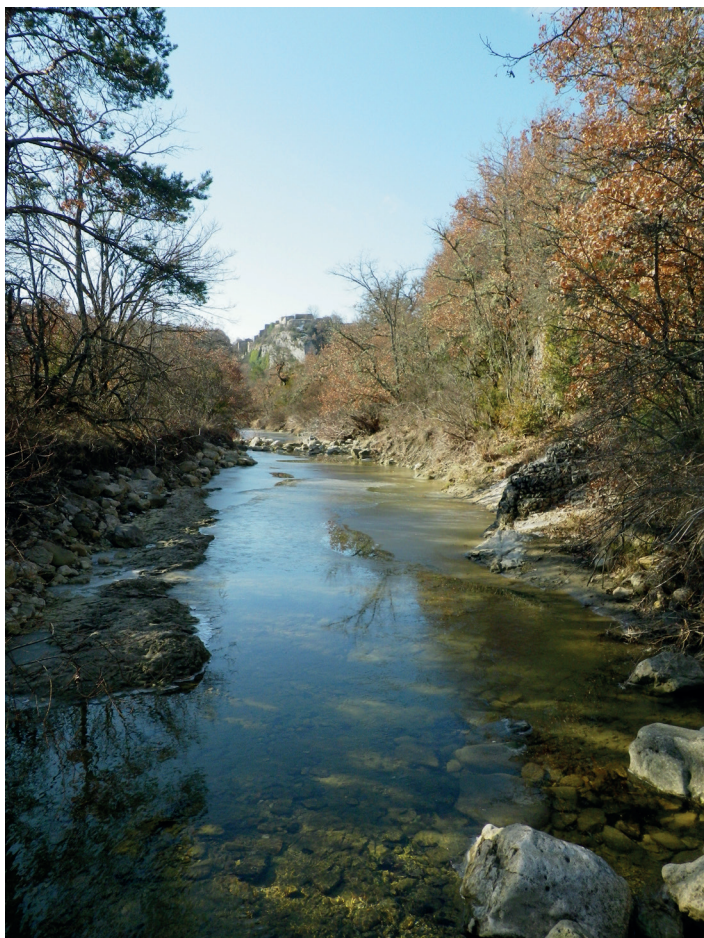
Calavon, povremena rijeka u Francuskoj, u toku jesenje akvatične faze (lijevo) i ljetnje terestrične faze (desno).

Povremene rijeke i efemerni potoci (IRES) su vodeni tokovi koja prekidaju svoj tok i ponekad presušuju. IRES pokriva više od polovine svjetske riječne mreže na globalnom nivou i nastavljaju i dalje da se šire zbog globalnih promjena. IRES su veoma dinamični vodeni i kopneni ekosistemi koji se karakterišu bogatim biodiverzitetom i koji pružaju višestruke koristi društvu, uključujući vodu, hranu, transport i slobodno vrijeme.