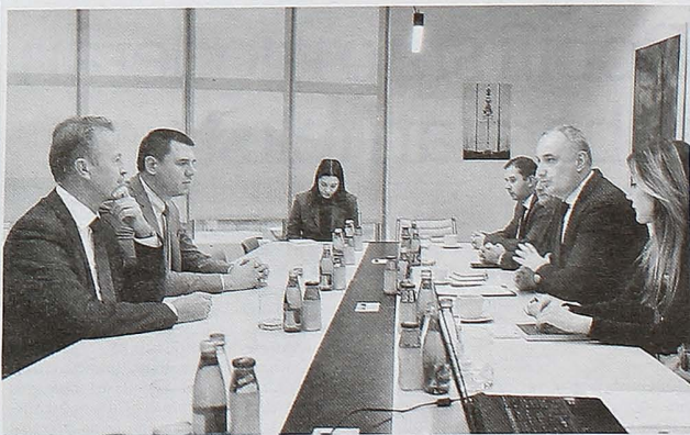
SA SASTANKA: Zaštita životne sredine je proces koji se nikada ne završava

O važnosti ove oblasti za samu Evropsku uniju i naš napredak prema evropskoj zajednici dovoljno govori činjenica da je poglavlje 27 jedno od najzahtjevnijih u pregovaračkom procesu i mi smo spremni da se, uz sve kapacitete koje imamo, suočimo sa izazovima. Zdrava životna sredina nije i ne smije biti luksuz, već osnovno ljudsko pravo – poručio je Drljević