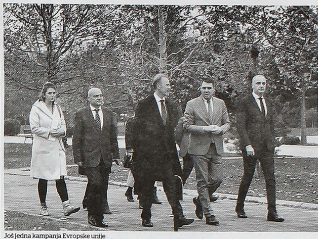
Još jedna kampanja Evropske unije

Otvoren park ispred zgrade Rektorata Univerziteta