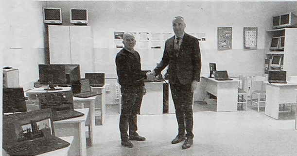
Ulaganje u obrazovanje

PODGORICA – Univerzitet Crne Gore donirao je Osnovnoj školi „Radoje Čizmović“ iz Ozrinica 15 laptop računara napominjući da ne treba