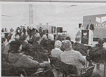
ŠANSI ZA STUDENTE I ZA POSLODAVCE. Na UCG otvorene dvije značajne manifestacije za mlade

UCG: Dani otvorenih vrata i Sajam sezonskih poslova u turizmu „Summer Job 2020“