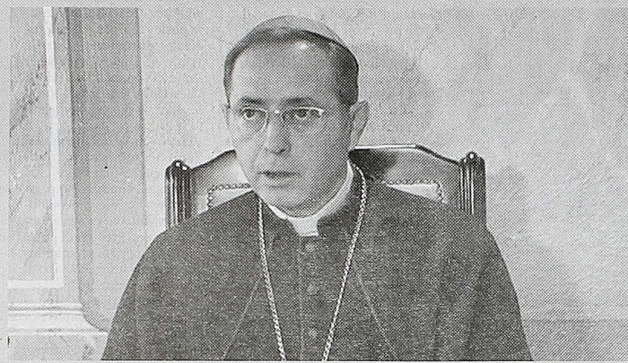
Rok Đonlešaj, nadbiskup barski i apostolski upravitelj Kotorske biskupije

- Ulice ne rješavaju bitne stvari, to rješava dobra volja, raspoloženje i spremnost na dijalog. To rješava samo zajednički jezik i to jezik ljubavi. Isus je rekao: „Po-