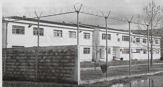
Zatvor u Spužu

Zakon je predložila vladajuća koalicija kako bi se, prema obrazloženju, kroz institut amnestije rasteretili zatvori i spriječio unošenje virusa u njih. Vlast je predložila da se osu- denici oslobode 10 odsto izrečene kazne osobe koje su na dan stu- panja ovog zakona pravosnaž- no osuđene za krivična djela propisana zakonima Crne Gore, a nису stupila na izvršavanje kazne, izrečena kazna zatvora zamjenjuje se uslovnom osu- dom, kazna zatvora uzima se kao utvrđena i istovremeno određuje da se ona neće izvrši- ti ako u roku od dvije godine osuđeni ne učini novo krivič-