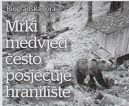
TRAGANJE ZA HRANOM: Mrki medvjed

- Osim mrkog medvjeda, na ranijim video snimcima registrovane su i divlja mačka, srna - naveli su iz Nacionalnih parkova Crne Gore. Služba zaštite obilazi teren a cilj je, kako su istakli, da snabudi hranilišta žitjem. Preuzimanje i video materijal sa kamera zamki koje su postavljene na različitim lokacijama. - U proceduri smo postavljanja