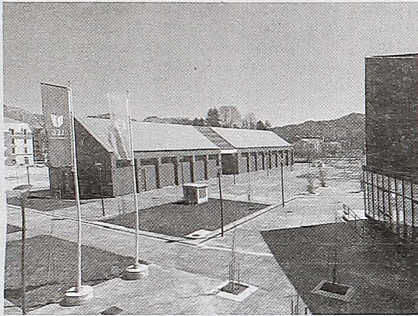
Njeguju identitetske vrijednosti

- UCG njeguje duh zajedništva i pripadnosti istoj akademskoj porodici, za oko 20.000 studenata, preko hiljadu akademskog i neakademskog osoblja, blizu 300 spoljnjih saradnika, i posebno radi na razvijanju osjećaja pripadnosti plemenitoj misli