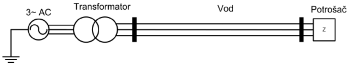
Slika 2. Jednopolna šema dijela elektroenergetskog sistema

Za dio elektroenergetskog sistema, čija je jednopolna šema prikazana na Slici 2, analizirati efekte atmosferskog pražnjenja u trenutku t = 25ms na početku voda na napon na sabirnicama potrošača.