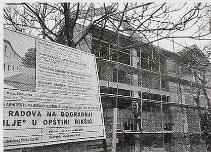
Gradilište objekta JU „Zahumlje“

NIKŠIĆ - Uprava javnih radova na području opštine Nikšić realizuje tri značajna projekta čija je ukupna vrijednost skoro 11 miliona eura, a zahvaljujući povoljnim vremenskim prilikama, radovi na gradilištima odlično napreduju.