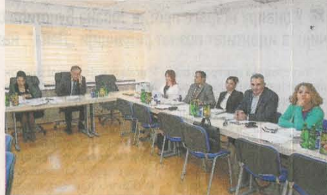
Са раније сједнице Судског савјета (архива)