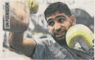
Одложио одлуку о повлачењу

Иако би бивши WBA и ИБФ шампион у лакој велтер категорији волио да се одмах бори за титулу, вјероватно ће морати да одради још једну борбу