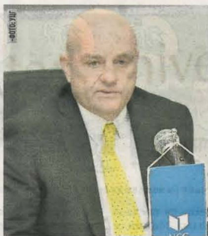
Умјесто у Цавтату онлајн преко интернета

- Све је више младих научника који активно и самостално учествују у научном програму конференције, што је један од високо позиционираних стратешких циљева у агенди Црногорске спортске академије. Мада је бројчано