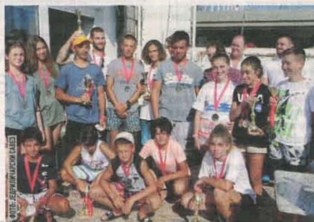
Побједници по класама