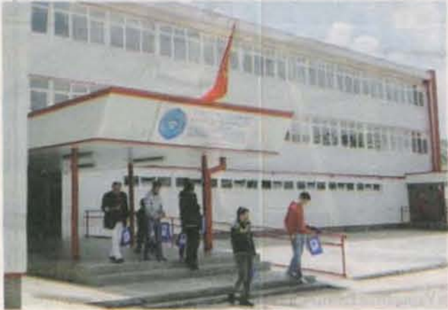
Факултет за спорт и ФВ

Факултет за спорт и физичко васпитање УЦГ би требало следеће године да добије фискултурну дворану, пошто је Влада Црне Горе на последњој сједници то уврстила у листу приоритета у капиталном буџету. Већ је урађен главни извођачки пројекат, а дворана ће се изградити уз зграду овог факултета.