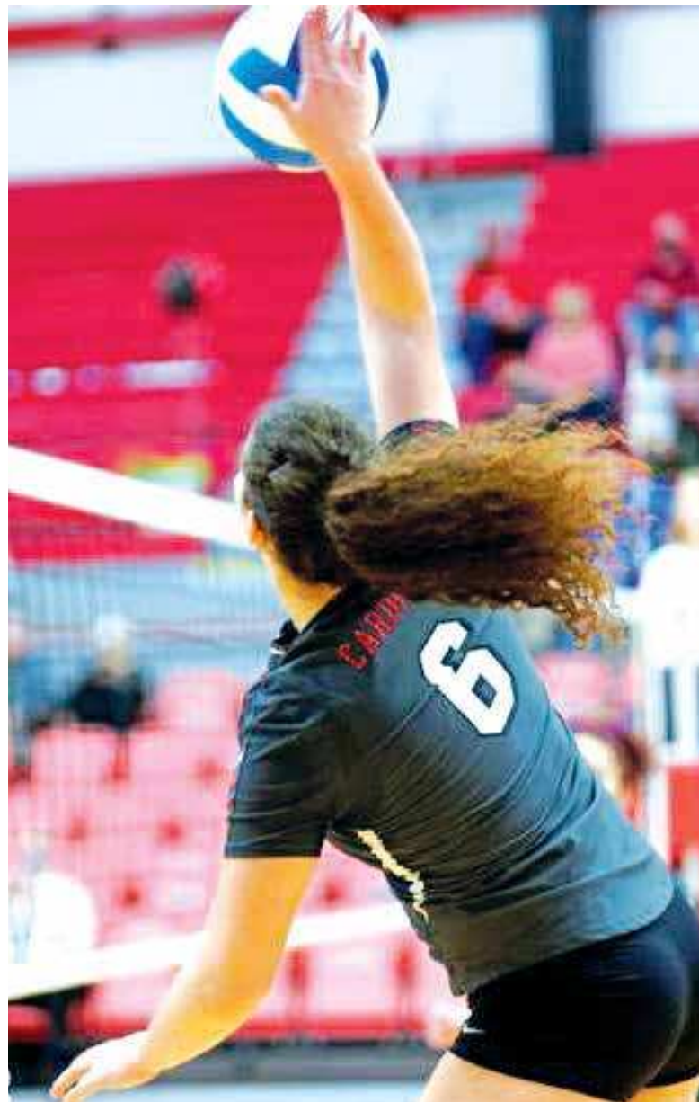
Свака утакмица је посебна

– Као „freshman“ морам се константно доказивати, како на терену тако и ван. Нереално је одмах очеки-