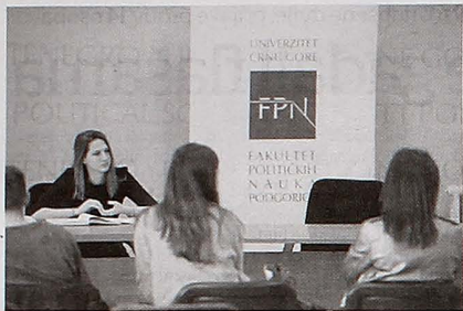
Sa jednog od predavanja

Tradicionalno veliko interesovanje za Fakultet političkih nauka