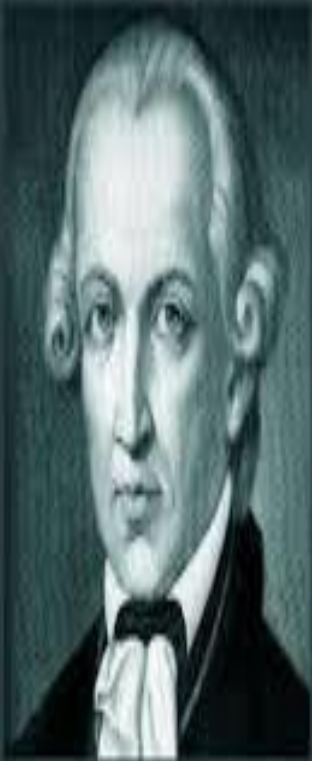
IMMANUEL KANT (1724-1804)