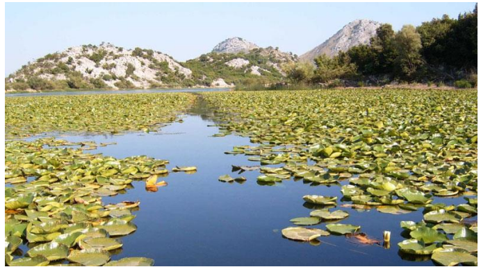
Slike 6 i 7: Prikaz Skadarskog jezera