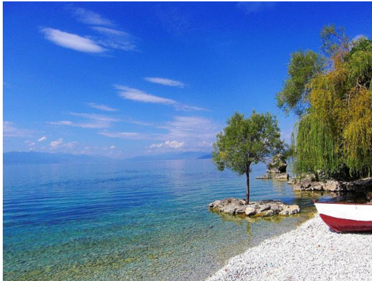
Slika 1: Ohridsko jezero

Oligotrofno jezero se odlukuje malim sadržajem hranljivih materija, pa je zbog toga siromašno fitoplanktonom. Ovakva jezera su najčešće prilično duboka. Temperatura vode je relativno niska i organizmi su prilagođeni takvim uslovima, voda je dosta providna. Dno ovakvih jezera je kamenito ili pjeskovito i karakteriše ga mala potrošnja O 2 . Tipičan primjer oligotrofije je Ohridsko jezero.