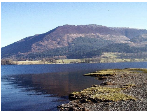
Slika 2: Bassenthwaite jezero u Engleskoj

Mezotrofno jezero je jezero koje se odlukuje srednjim sadržajem hranljivih materija, pa se prema produkciji nalaze između eutrofnih i oligotrofnih jezera. Dubina vode kod ovakvih jezera je 3-5 metara i karakteriše ih umjerena količina nutrijenata i umjerena produktivnost.