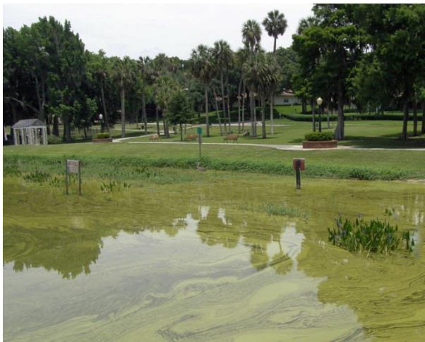
Slika 3: Jezero Dora na Floridi, SAD

Eutrofno jezero je jezero koje se odlikuje velikim sadržajem hranjivih materija. Takva jezera nisu relativno duboka. Eutrofne jezerske basene karakteriše intenzivna produkcija fitoplanktona. U vezi s tim, dolazi do velikog taloženja organskih materija na dnu basena, za šta se koristi značajna količina kiseonika, pa ovakva jezera oskuduju njime. Česta je pojava cvjetanja vode.